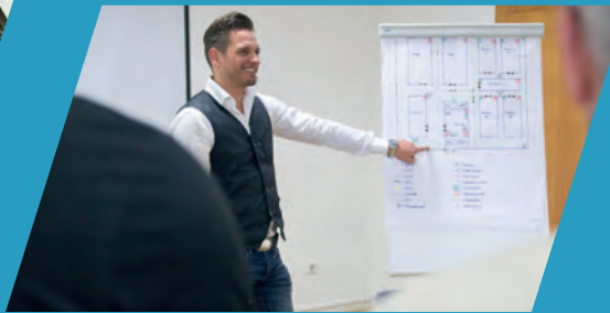
Zertifizierte Aus- und Weiterbildungen auf höchstem Niveau